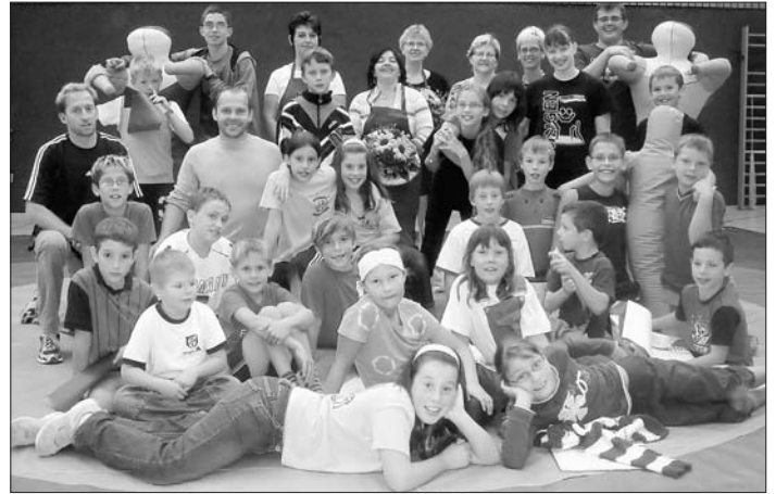
Sommerferien mit Spaß und Spiel – der KSV macht's möglich

Auf jeden Fall kam das Montagsprogramm so gut an, dass am Dienstag alle wieder da waren. An diesem Tag fand auch das Highlight statt, nämlich eine gemeinsame Übernachtung in der Sporthalle. Nachmittags waren alle im Freibad und bevor es nach dem Abendessen endgültig in die Betten, bzw. auf die Ringermatte ging, auf der genächtigt wurde, gab es noch einen Videoabend und danach eine Nachtwanderung mit